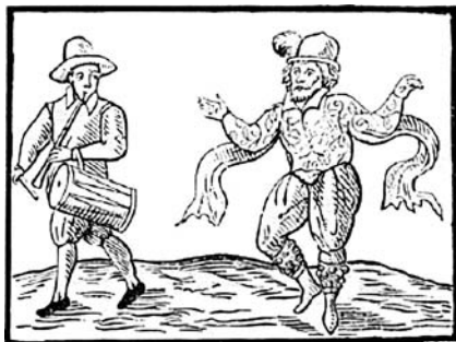
William Kemp lors de son Nine Daies Wonder

Cette association entre «gigue» ou «jig» et les rythmes ternaires est