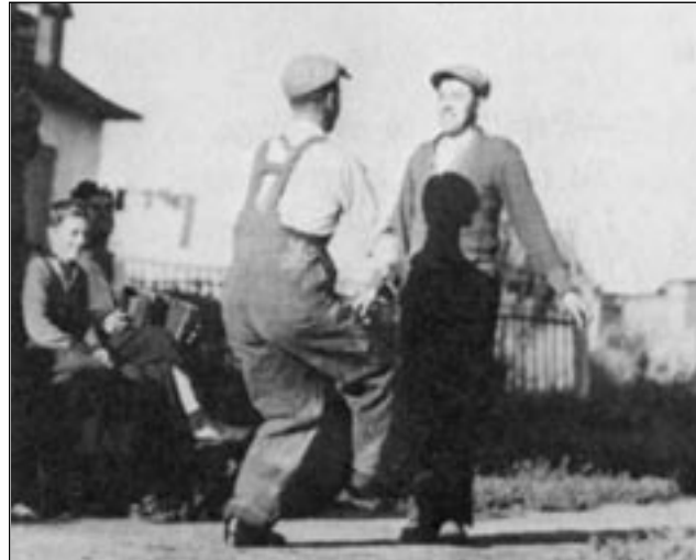
Deux danseurs, à la Jeune-Lorette, 1941. Tirée de « Le Rossignol y chante » par Marius Barbeau, Musée national de l'Homme (Musées nationaux du Canada), Ottawa, 1979, p. 82

pieds et des mains, comme de nos Savoyards; les deux danseurs sont en face sur une petite planche. Danse rapide, tournante, tourbillonnante. Le premier épuisé se retire, un autre