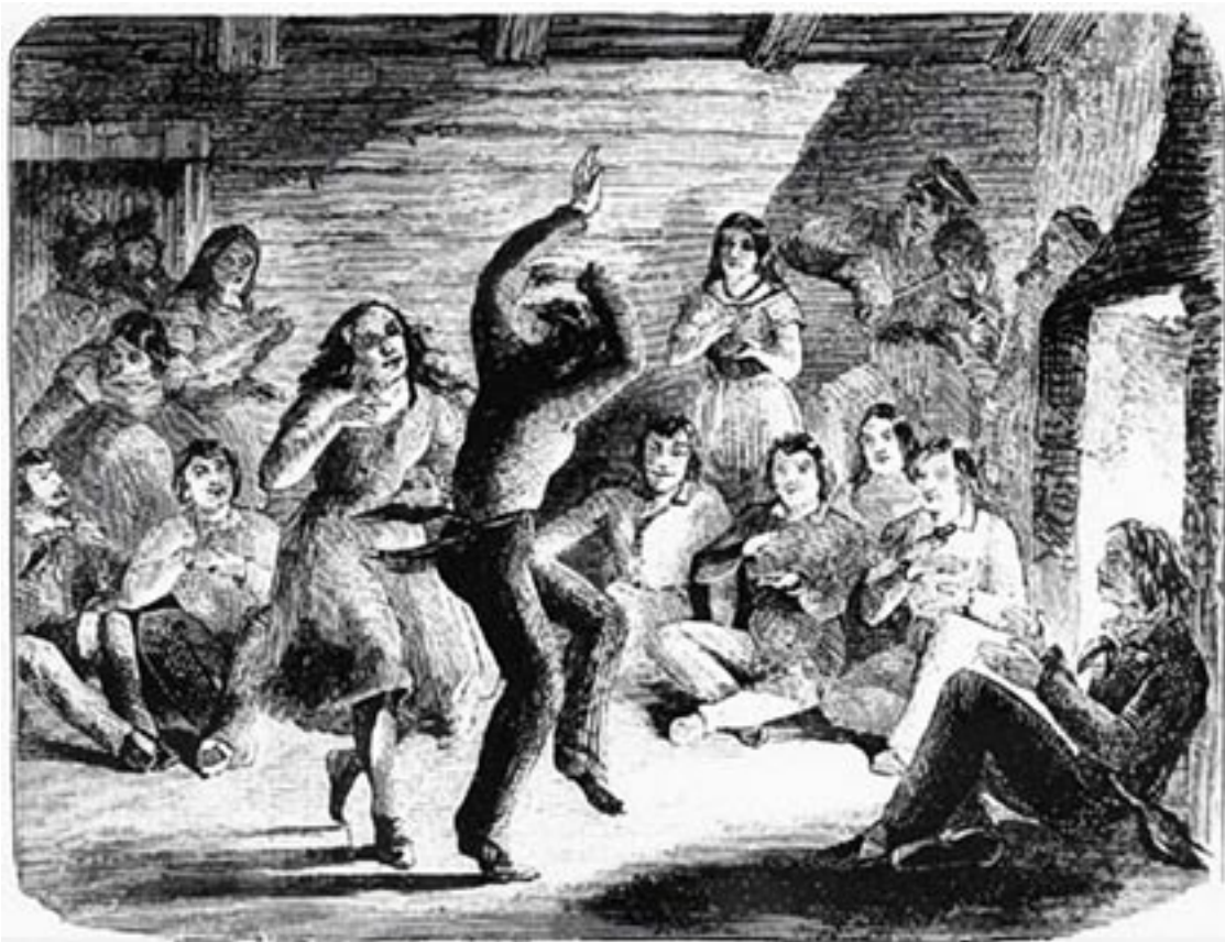
Les Métis dansent la gigue de la Rivière-Rouge, vers 1860. Au 20 e siècle, ce divertissement se transforme en compétition de danse à l'occasion des concours de violoneux.

du moins dans la forme que nous lui connaissons (avec le shuffle / treble / frotté 5 , et son accompagnement rythmique fort précis) 6 . L'appellation stepdancing n'est d'ailleurs pas réservée qu'à la danse dite percussive, mais également aux « danses de pas » écossaises ou françaises. Ici encore la prudence est de mise.